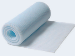
402068 RULL POSAGOTS 400 x 34 cm. 8 u./caixa. Posa vasos triple capa. Crea una cambra d'aire sota dels gots, copes i parament per a accelerar l'asseccament.