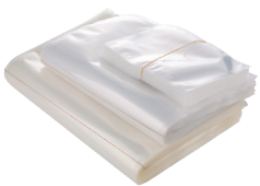
502000 BOSSA BUIT (PA/PE 90) Bosses per envasar al buit.