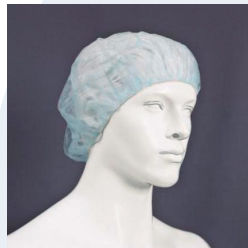
400102 GORRO (X100) Gorro d'un sol ús de teixit de polipropilè.