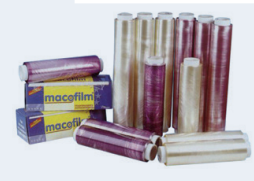
209028 | 305042 BOBINA FILM PVC 30 x 300 | 45 x 300 Film transparent molt resistent i adherent.