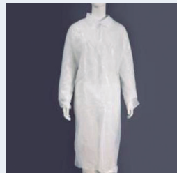
400103 DAVANTAL BLANC (X100) Davantal de polietilè de color blanc d'un sol ús.