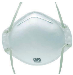
400100 MASCARETA FFP1 (X20) Mascareta amb goma per ajustar.