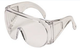
400105 ULLERES DE PROTECCIÓ Ulleres de policarbonat. Protecció ocular neutra.