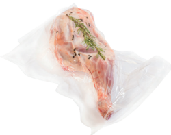
502008 BOSSA PASTEURITZACIÓ 300 x 400 (100*90mi) (x1000) Bosses de coccio per a cuinar i envasar al buit.